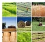
MALLA ELECTROSOLDADA, ETIQUETADO, YUTE Y OTROS